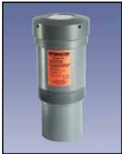
SmartSonic Transmisor Ultrasonico