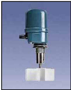
Mini Indicador Rotativo

Requisitos de Energía: 24/115/230 VAC, 50/60 Hz, 12/24 VDC mA, 60/35 Salida de Relé: DPDT de 10 amperios, 250 VAC Indicador de Estado de Relé: SPDT de 10 amperios, 250 VAC (relé de estado sólido opcional) Temperatura Ambiente de Funcionamiento: -40°F a 185°F (-40°C a +85°C) Proceso Temperatura: Hasta +400°F (204°C) Presión: 1/2 micrones, 30 PSI Aprobaciones y Certificaciones: CSA para la Clase II, Grupos E, F, G Ex II 1D Ex tD A20 IP66 T93C (Ta = -20C to +85C) Tipo de Cobertura/Caja: NEMA 4X, 5, 9 & 12 Caja: Aluminio fundido, aprobado por la USDA en acabado en polvo de capa Montaje: 1-1/4 "NPT Conexión de los Conductos: 3/4 "NPT Eje y Componentes: Acero inoxidable