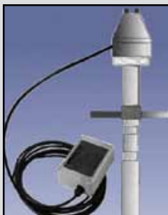
PRO HTRC-20 Sensor de Capacidad

Requisitos de Energía: 115, 230 VAC o 24 VDC Salida de Relé: SPDT 5 amperios a 250 VAC Temperatura Ambiente: -40°F a 185°F (-40°C a +85°C) Temperatura del Proceso: Hasta 240°F (116°C) Presión: 150 PSI Aprobaciones y Certificaciones: NEMA 4X, 5 y 12 Caja o Cobertura: PVC Sonda: CPVC Montaje: 1" NPS (1-1/4" adaptador disponible) LED: Indica la presencia o ausencia de material