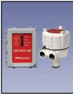
Detección de Flujo 1000 Detección de Flujo por Microondas