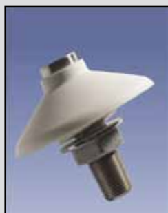
Airbrator Aireación y Vibración

Voltaje de Entrada: 115 VAC ± 10%, 50/60 Hz, 3 VA. 230 VAC ± 10%, 50/60 Hz, 3 VA. 24-48 VCC, 2 W máximo Relé: SPDT, 2 amperios 240 VAC Caja o Cobertura: NEMA 4X Temperatura de Funcionamiento: -4°F a 158°F (-20°C a +70°C) Garantía: Un año