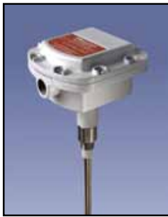
Detección de Polvo 1000 Detección de Polvo