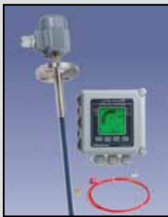
BM-30 LGX Monitoreo de Partículas