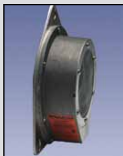
BM-65 Interruptor de Diafragma

Clasificaciones del Interruptor: 15 Amps a 125, 250 o 480 VAC, 1/8 HP @ 125 VAC, 1/4 HP @ 250 VAC, 1/2 amperios @ 125 VDC, 1/4 amperios @ 250 VDC Temperatura de Funcionamiento: -40°F a 300°F (-40°C a +149°C) Caja o Cobertura de Protección: Aluminio fundido Montaje: Interna o externa, de calibre 16 placa galvanizada de montaje