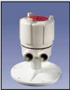
PROCAP I & II Sensor de Capacidad

PROCAP I 3-A Requisitos de Energía: Fuente universal de alimentación 24 a 240 VAC/VDC PROCAP II 3-A Requisitos de Energía: 115/230 VAC seleccionable Salida de Relé: DPDT de 10 amperios a 250 VAC Temperatura Ambiente: -40°F a 185°F (-40°C a +85°C) Proceso de Temperatura: A 250°F sonda Delrin (121°C); a 500°F sonda de Teflón (260°C) Presión: 500 PSI Aprobaciones y Certificaciones: En la lista de Clase II, Grupos E, F y G para lugares peligrosos Tipo de Caja o Cobertura: NEMA 4X, 5, 9 y 12 Caja de Protección: Aluminio fundido, USDA aprobado acabado en polvo Montaje: 1" o 2.5" reborde sanitario