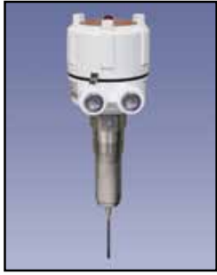
VR-21 Varilla Vibrante