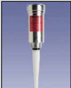
SmartWave Transmisor de Radar de Pulso