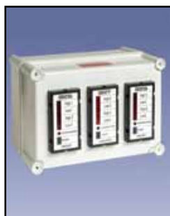
Panel de Alarma para Nivel de Puntos

Clasificaciones del Interruptor: 15 Amps a 125 o 250, 1/8 HP @ 125 VAC, 1/4 HP @ 250 VAC, Amp 1/2 @ 125 VDC, 1/4 amperios @ 250 VDC Temperatura de Funcionamiento: -40°F a 300°F (-40°C a +149°C) Aprobaciones y Certificaciones: En la lista de Clase II, Los Grupos E, F y G para lugares peligrosos Tipo de Caja o Cobertura: NEMA 4, 5, 9 y 12 Caja de Protección: Aluminio fundido Montaje: Interna o externa, de calibre 16 placa galvanizada de montaje