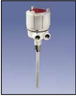
PROCAP I & II Sensor de Capacidad