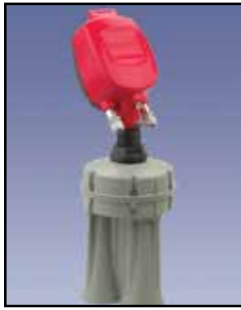
3DLevelScanner Sensor Sin-Contacto