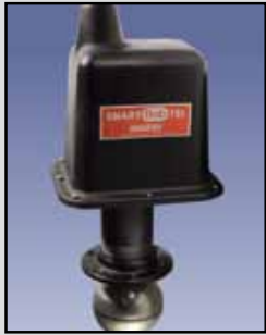
SmartBob - TS1 Sensor Cable-Basado