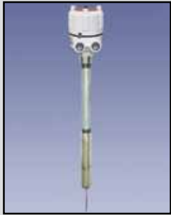
VR-41 Varilla Vibrante

Requisitos de Energía: Una amplia gama 20-250V AC/DC Relé: El relé de SPDT, 5A @ 250 VAC (Opcional de relé DPDT está disponible) Tiempo de Retardo: 1 segundo de la parada de la vibración, 2 a 5 segundos para el inicio de las vibraciones Temperatura Ambiente: -4°F a 140°F (-20°C a +60°C) Proceso de Temperatura: A 176°F estándar (80°C); a 284°F de alta temperatura (140°C) Presión: 145 PSI Caja o Cobertura: Aluminio fundido, tipo NEMA 4, 5 y 12 Sonda: 304 de acero inoxidable 304, longitud de inserción 7.37" Montaje: 1-1/2" NPT Densidades del Material: Desde 1.25 libras/pie cu.