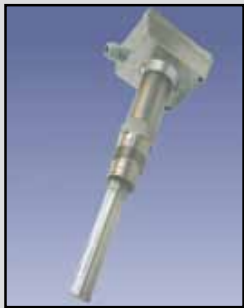
SHT-120/140 Varilla Vibrante

Requisitos de Energía: Ampla gama 20-250VAC/DC Consumo de Energía: 3 VA Relé: SPDT 5A 250 VAC Tiempo de Retardo: 1 segundo de detenerse la vibración, 2 a 5 segundos para el inicio de las vibraciones Temperatura ambiente: -4°F a 150°F (-40°C a +65°C) Proceso de Temperatura: A 176°F estándar (80°C); a 300°F de alta temperatura (150°C) Presión: 145 psi Cableado del cable: 1/2" Montaje: 1" NPT Caja/Cobertura: Aluminio fundido, NEMA 4, 5 y 12 Sonda: 304 acero inoxidable, 6" longitud de inserción La Densidad del Material: De 3.5 libras/pie cu.