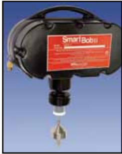
SmartBob2 Sensor Cable-Basado