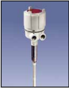
PROCAP IX & IIX Sensor de Capacidad

PROCAP I Requisitos de Energía: Fuente universal de alimentación 24 a 240 VAC/VDC PROCAP II Requisitos de Energía: Seleccionable 115/230 VAC Salida de Relé: DPDT de 10 amperios a 250 VAC Temperatura Ambiente: -40°F a 185°F (-40°C a +85°C) Proceso de Temperatura: A 250°F Delrin/sonda al descubierto (121°C); a 500°F sonda de Teflón (260°C) Presión: 500 PSI Aprobaciones y Certificaciones: En la lista de Clase II, Los Grupos E, F y G para lugares peligrosos Tipo de Caja o Cobertura: NEMA 4X, 5, 9 y 12 Caja de Protección: Aluminio fundido, Aprobada por el USDA en polvo capa de acabado Montaje: 1-1/4" NPT o 3/4" NPT 316 SS estándar, 1-1/4" NPT 316 SS & reborde sanitario opcional