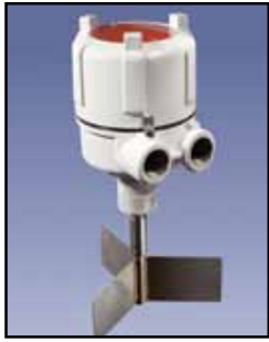
BMRX Indicador Rotativo