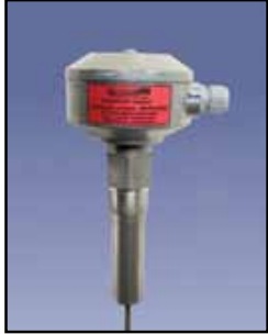
CVR-600 Varilla Vibrante

Requisitos de Energía: Una amplia gama 20-250V AC/DC Relé: El relé de SPDT, 5A @ 250 VAC (Opcional de relé DPDT está disponible) Tiempo de Retardo: 1 segundo de la parada de la vibración, 2 a 5 segundos para el inicio de las vibraciones Temperatura Ambiente: -4°F a 140°F (-20°C a +60°C) Proceso de Temperatura: A 176°F estándar (80°C); a 284°F de alta temperatura (140°C) Presión: 145 psi Caja/Cobertura: Aluminio fundido, NEMA 4, 5 y 12 Sonda: 304 Acero inoxidable, longitud de inserción 13" a 13' Montaje: 1-1/2" NPT Materiales Densidades: Desde 1.25 libra/pie cu.