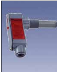
Compact PRO Sensor de Capacidad

Requisitos de Energía: 115/230 VAC, 50/60 Hz \pm 15%, 5 VA Salida de Relé: DPDT de 10 amperios a 250 VAC Temperatura Ambiente: -40°F a 185°F (-40°C a +85°C) Proceso de Temperatura: A 250°F sonda Delrin al descubierto (121°C); a 500°F sonda de Teflón (260°C) Presión: 500 PSI Aprobaciones y Certificaciones: En la lista de Clase II, Los Grupos E, F y G para lugares peligrosos Tipo de Caja o Cobertura: NEMA 4X, 5, 9 y 12 Caja de Protección: Aluminio fundido, aprobada por el USDA en acabado en polvo Montaje: 1-1/4" NPT o 3/4" NPT 316 estándar de acero inoxidable, 1-1/4" NPT en acero inoxidable 316 y reborde sanitario