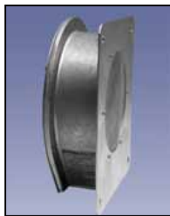
BM-45 Interruptor de Diafragma