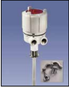
PROCAP I & II 3-A Sensor de Capacidad

PROCAP IX Requisitos de Energía: Fuente universal de alimentación 24 a 240 VAC / VDC PROCAP IIX Requisitos de Energía: Seleccionable 115/230 VAC Salida de Relé: DPDT de 10 amperios a 250 VAC Temperatura Ambiente: -40°F a 185°F (-40°C a +85°C) Proceso de Temperatura: A 250°F sonda Delrin (121°C); a 500°F sonda de Teflón (260°C) Presión: 500 PSI Aprobaciones y Certificaciones: En la lista de las Categorías I, Grupos C, D y Clase II, Grupos E, F y G para lugares peligrosos Tipo de Caja o Cobertura: NEMA 4X, 5, 7, 9 y 12 Caja de Protección: Aluminio fundido, USDA aprobado acabado en polvo Montaje: 1-1/4" NPT o 3/4" NPT 316 SS estándar, 1-1/4" NPT 316 SS y reborde sanitario opcional