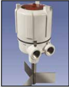
MAXIMA+ Indicador Rotativo

Requisitos de Energía: 24/115/230 VAC, 50/60 Hz, 24 /12 mA VCC, 60/35 Contactos de Salida: DPDT de 10 amperios, 250 VAC Temperatura Ambiente de Funcionamiento: -40°F a +185° F (-40°C a +85°C) Proceso de Temperatura: Hasta +400°F (204°C) Presión: 1/2 micrones, 30 PSI Aprobaciones y Certificaciones: CSA/US Clase I, Grupos C y D y Clase II, Grupos E, F y G Ex II 2G 1D Ex d IIB T5 Ex tD A20 IP66 T93C (Ta = -20C to +85C) Tipo de Cobertura/Caja: NEMA 4X, 5, 7, 9 y 12 Caja: Aluminio fundido, aprobada por el USDA en acabado en polvo capa Montaje: 1-1/4 "NPT Conexiones de los Conductos: 3/4 "NPT Eje y Componentes: Acero inoxidable