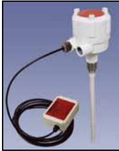
PRO REMOTE Sensor de Capacidad